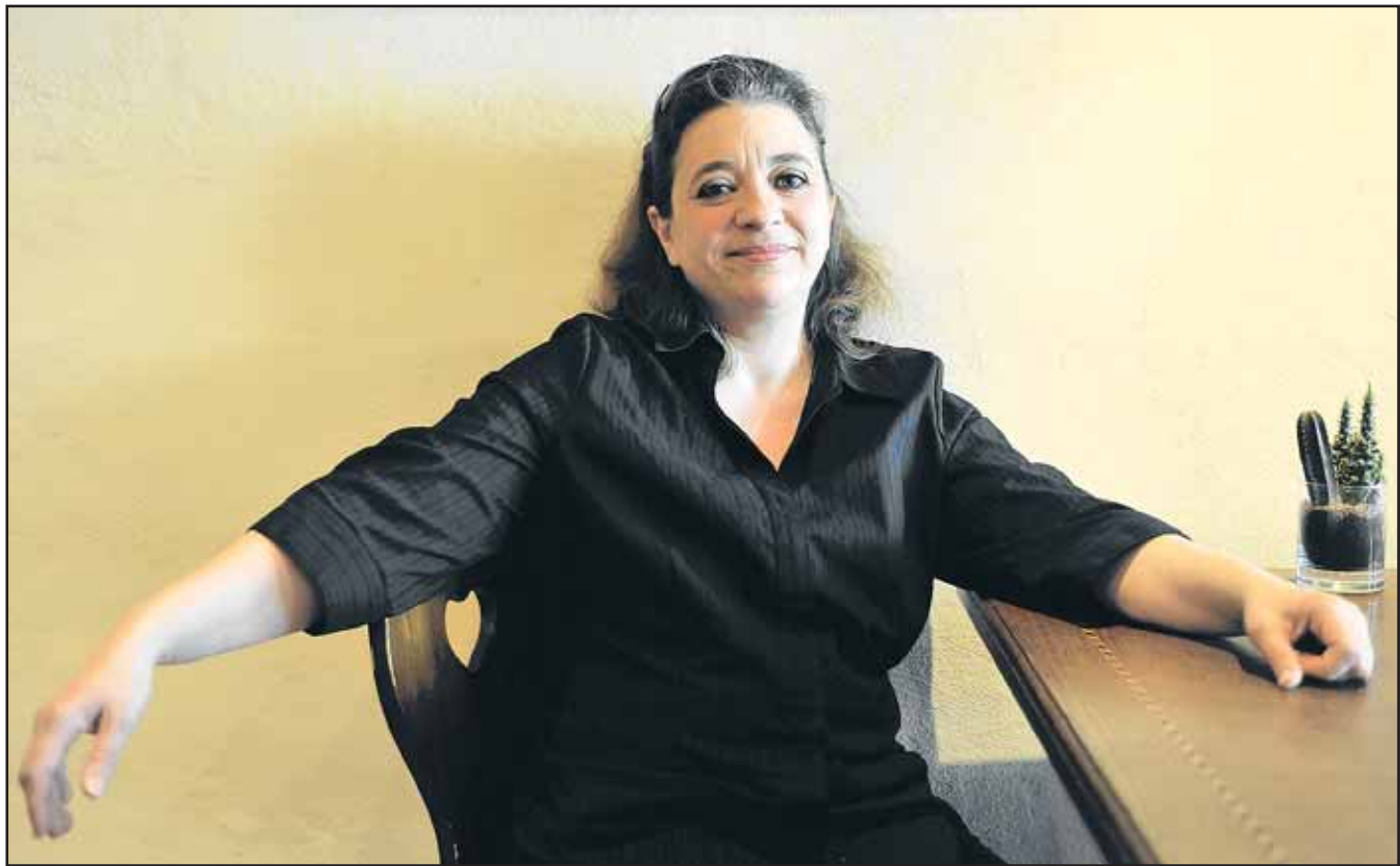
Edité à compte d'auteur, «Les festins fantastiques des contes de Gruyère» est le 5 e livre d'Isabelle Kallenborn, disponible sur lulu.com.

> Isabelle Kallenborn, «Les festins fantastiques des contes de Gruyère», Ed. Christiane Kolly, 101 p.